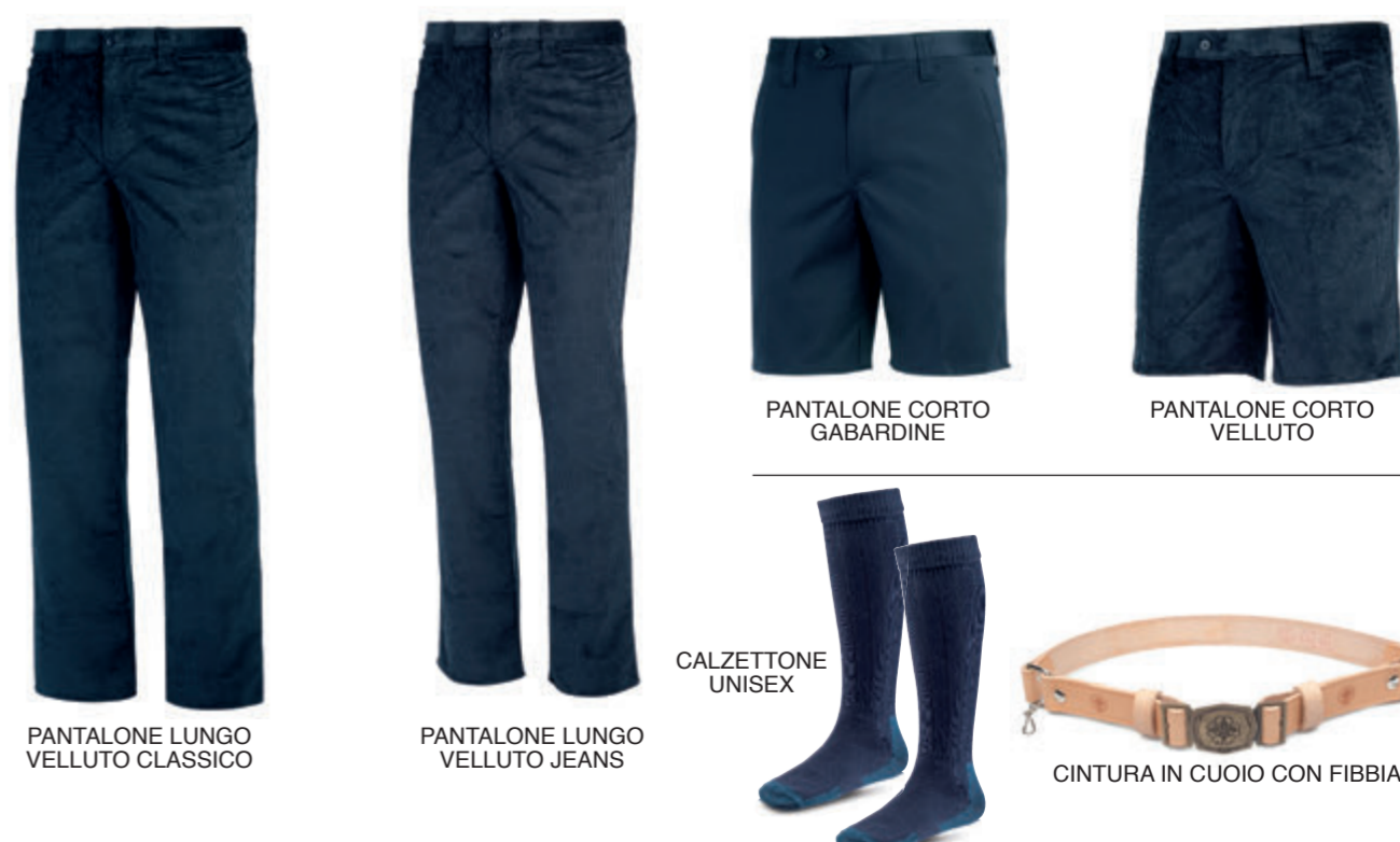
PANTALONE LUNGO VELLUTO CLASSICO